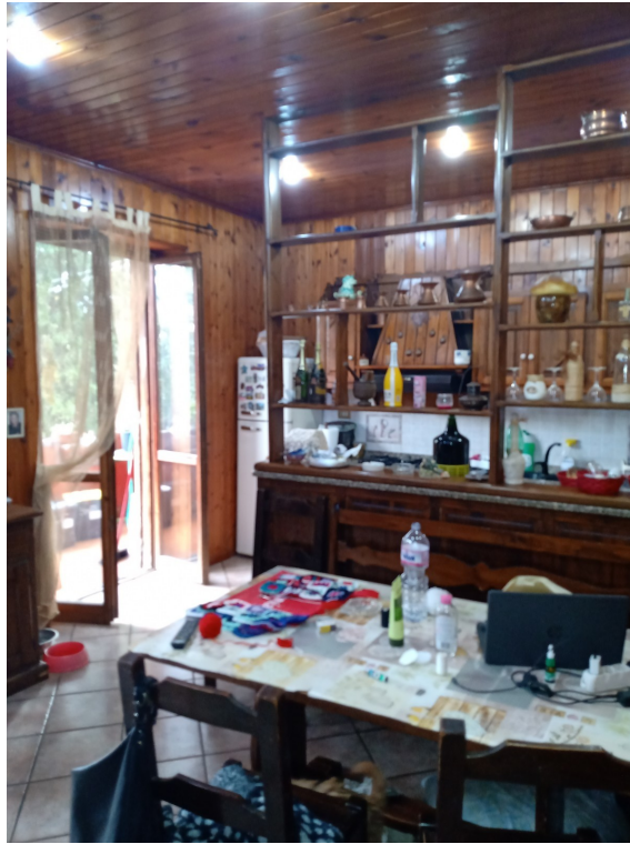
Fotografia F.19 - Foto n.1 Cucina Sud-Est