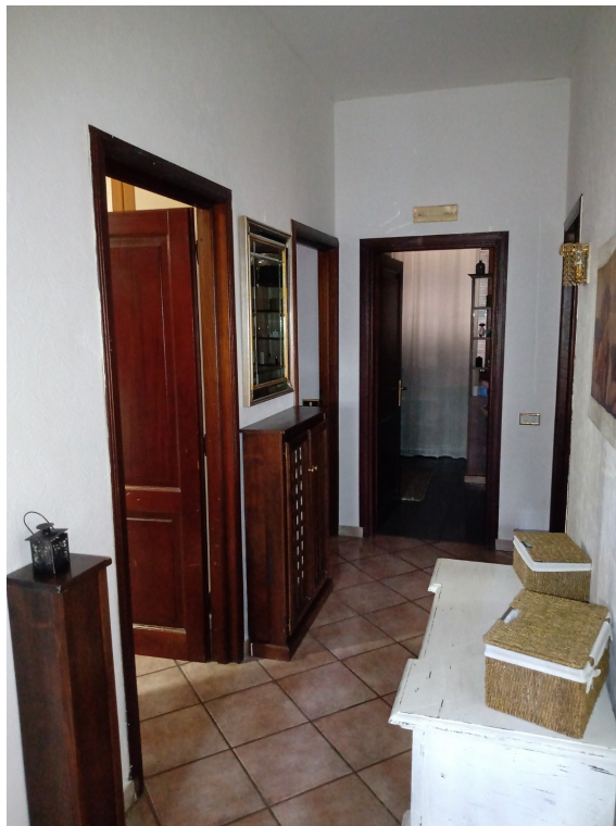
Fotografia F.10 - Foto n.1 - Corridoio a Nord-Est