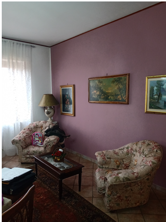
Fotografia F.8 - Foto n.2 - soggiorno