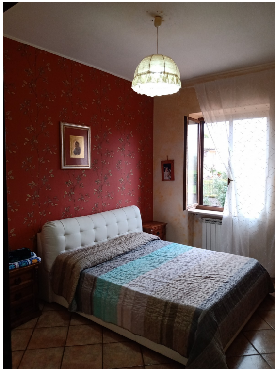
Fotografia F.12 - Foto n.1 - Camera matrimoniale -Sud-Ovest