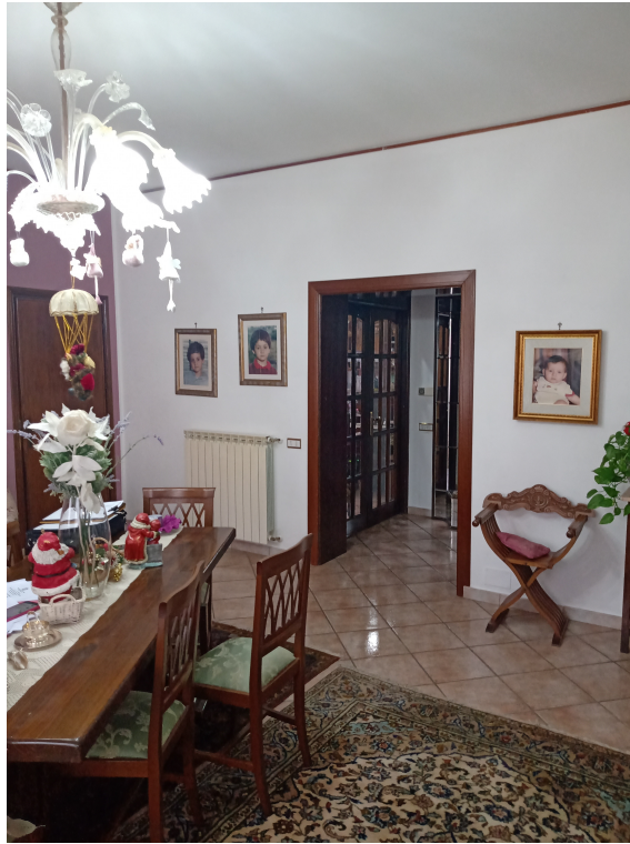
Fotografia F.9 - Foto n.3 - Soggiorno