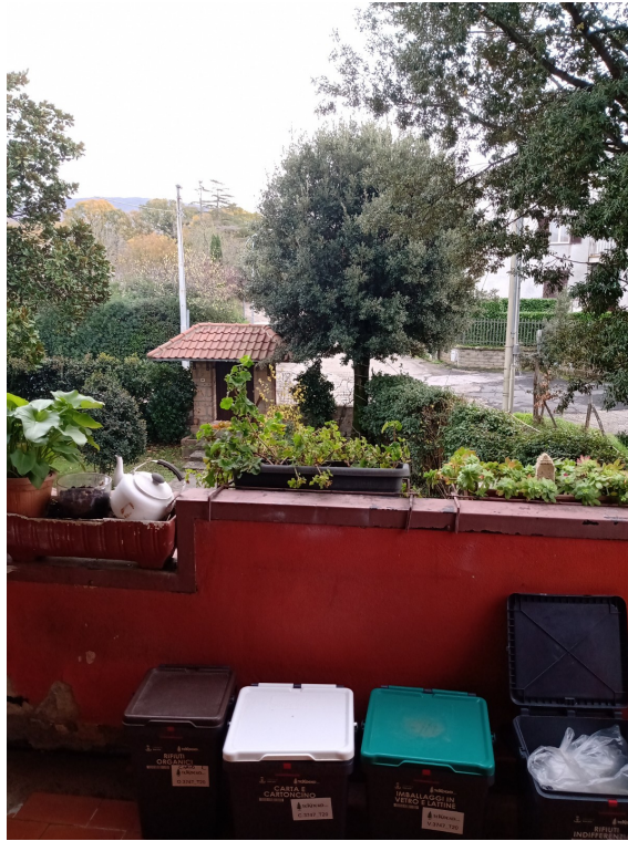
Fotografia F.21 - Foto n.3 balcone Sud- Est