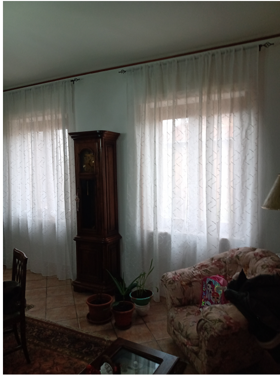
Fotografia F.7 - Foto n.1- Soggiorno