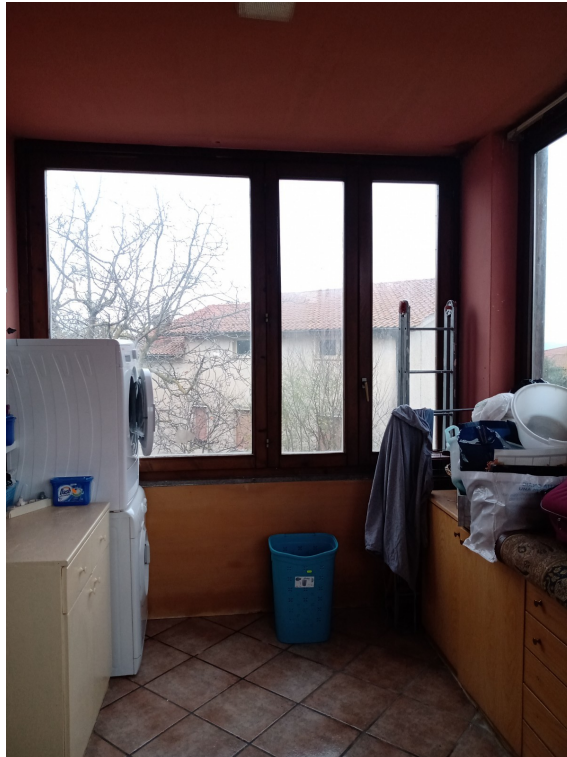
Fotografia F.15 - Foto n. 2a Veranda chiusa Nord-Est