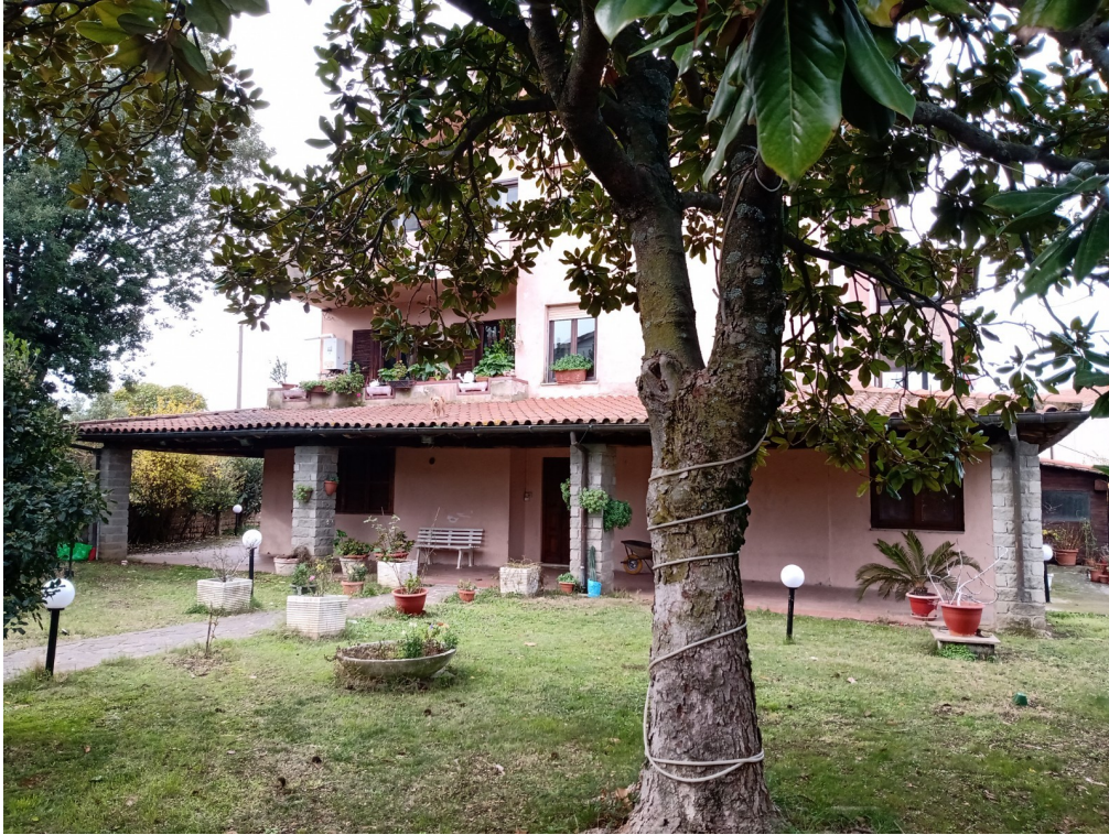
Fotografia F.3 - Esposizione NORD-EST - veduta giardino di pertinenza ai sub 1-2-3-5