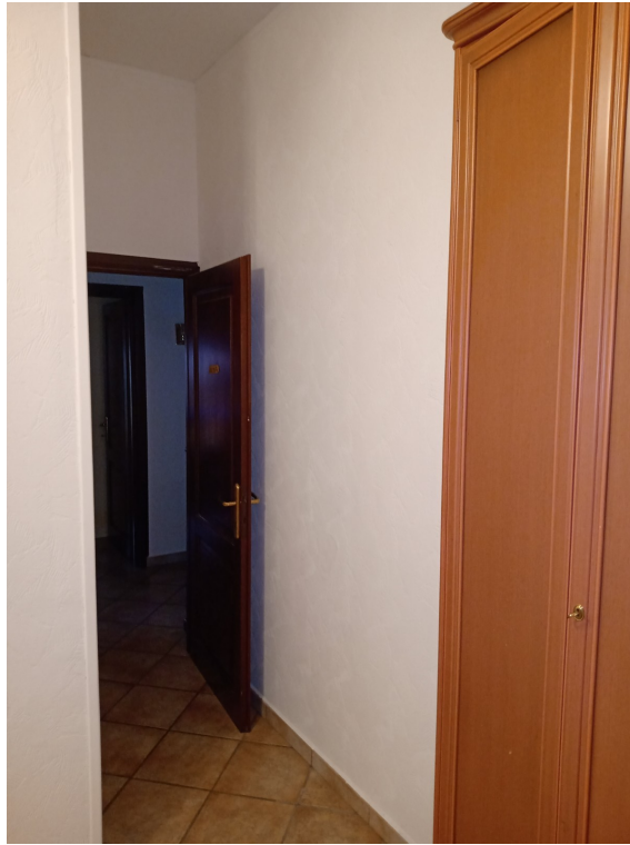
Fotografia F.17 - Foto n.1 - Stanza