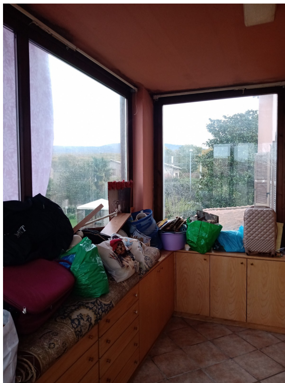
Fotografia F.16 - Foto n.2b Veranda