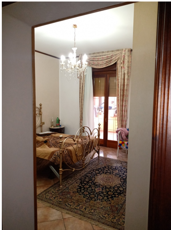
Fotografia F.14 - Foto n. 2 Camera Sud-Est