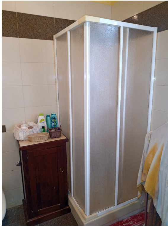
Fotografia F.23 - Foto n.2 cabina doccia bagno