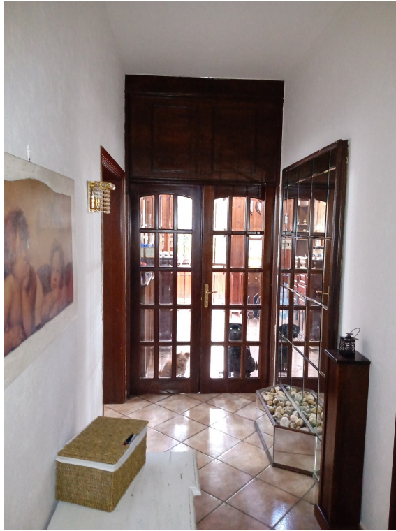
Fotografia F.11 - Foto n.2- Corridoio a Sud-est