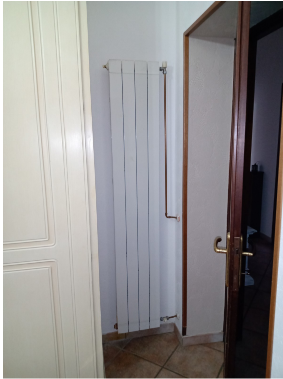
Fotografia F.13 - Foto n.1 Elementi radianti a pareti