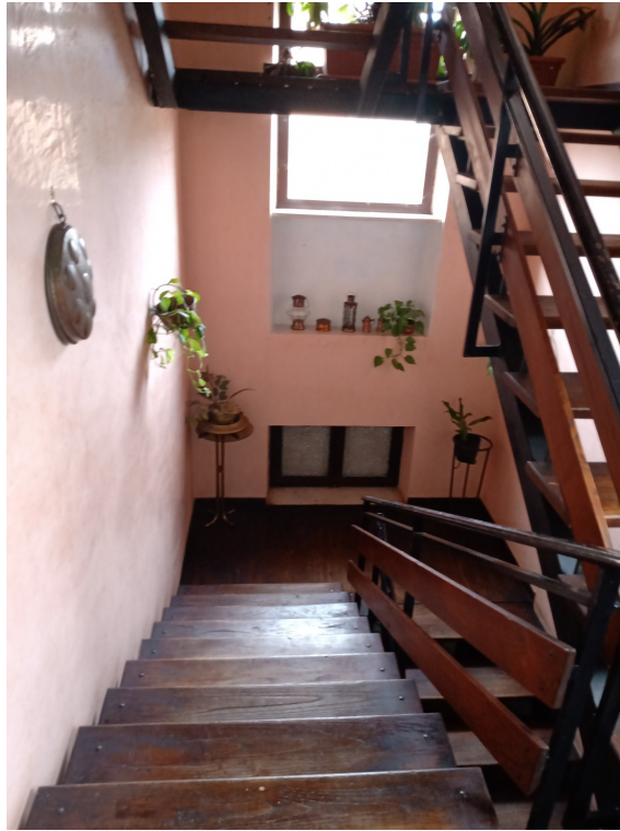
Fotografia F.5 - Veduta vano scala comune, struttura portante in ferro scatolare, gradini e parapetto in tavole di legno. Molto luminoso