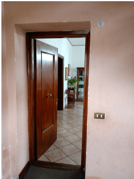
Fotografia F.6 - Porta di ingresso dell'immobile pignorato, piano primo