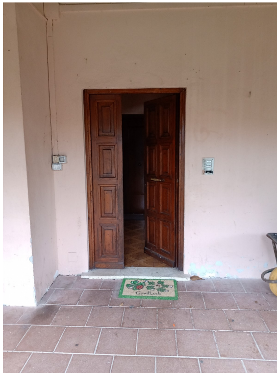
Fotografia F.4 - Porta di ingresso accesso vano scala comune - Esposizione NORD-EST