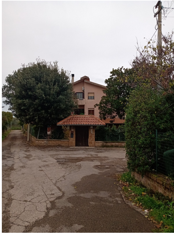
Fotografia F.1 - Ingresso principale SUD-EST civico n.12-11