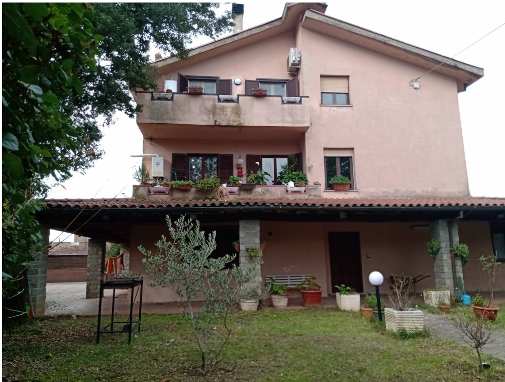
Fotografia F.2 - Esposizione SUD-EST - villino con quattro unita' immobiliari circoscritto da area di pertinenza (Area Ente Urbana)