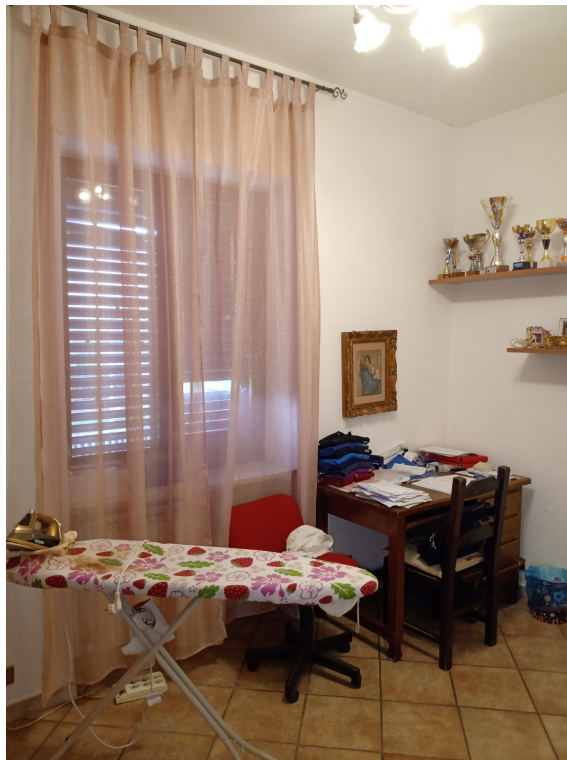
Fotografia F.18 - Foto n. Stanza Sud-Ovest