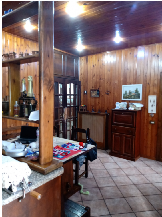
Fotografia F.20 - Foto n.2 Cucina Sud-Est