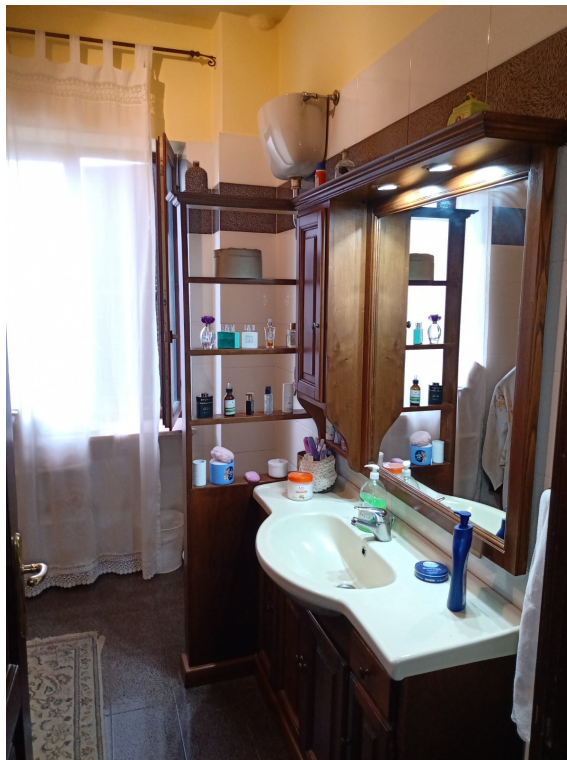
Fotografia F.22 - Foto n.1 bagno Nord-Ovest